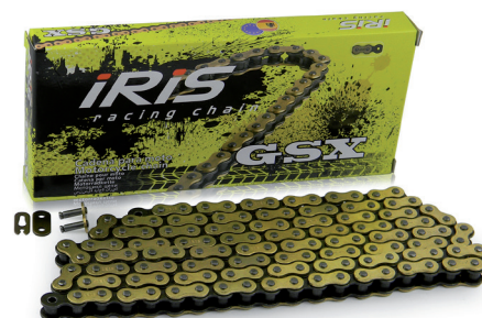
415 GSX (G/B)