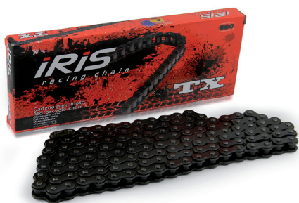
415 TX (B/B)