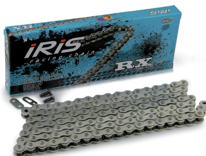
415 RX (S/S)