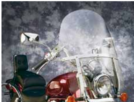
TOURING HEAVY DUTY