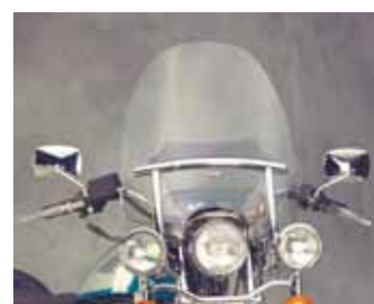
CUSTOM HEAVY DUTY mit BILLET TRIM