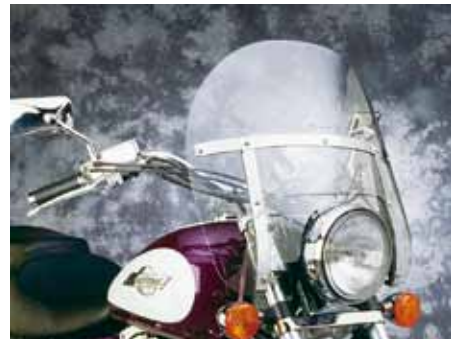
CHOPPED HEAVY DUTY