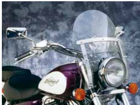
RANGER HEAVY DUTY

Die Scheiben sind in leicht getöntem LEXAN, die Halterung ist entsprechend der Tabelle separat zu bestellen!